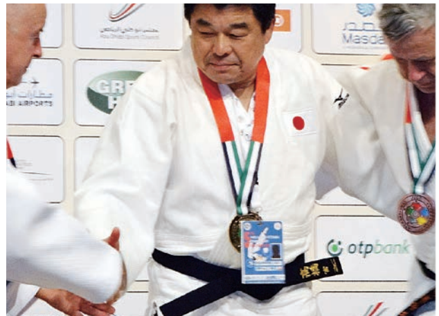
世界ベテランズ柔道大会（2013. アブダビ）

各OB団体の理事（二人）構成を見つめると「平成卒」がいかに少ないことか。今や私のような65歳以上が日本の総人口の26%を占めて4人に一人という高齢化の時代である。各OB会の長老もますます元気であろうが、平成卒の役員がもっと増えていい。平成になってからの卒業生も今や50に近い親父である。その方々に本会の運営に口を挟んでもらい戦力となって後押しをしていただきたい。