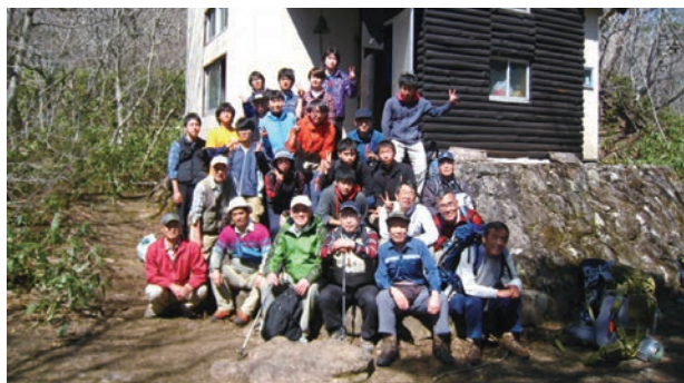
平成26年5月、倉石ヒュッテにおいて現役部員とOB会の交流会を実施しました