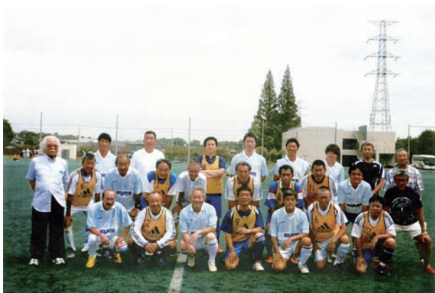
東北学院大学サッカー部OB会