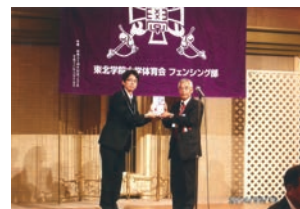
在校生への記念品購入資金贈呈