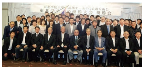
柔道部交流会兼祝勝会（来賓・部員・OB・後援会）