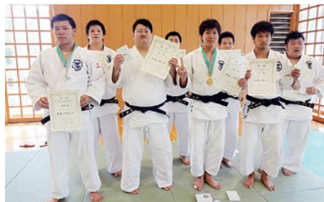
東北学生柔道体重別選手権大会入賞者（秋田県立武道館）