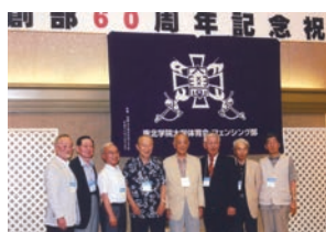
卒業年代別会員の近況報告