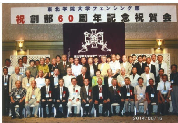
出席者全員で記念写真