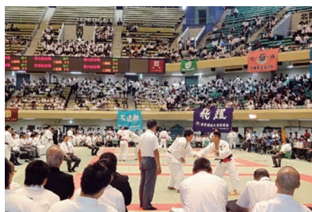
2014全日本学生柔道優勝大会（日本武道館）