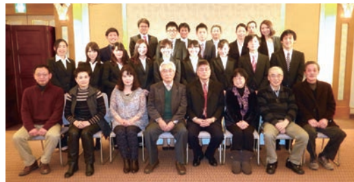
新年会及び新入会員【26年卒業生】招待懇親会 2月 パレス平安